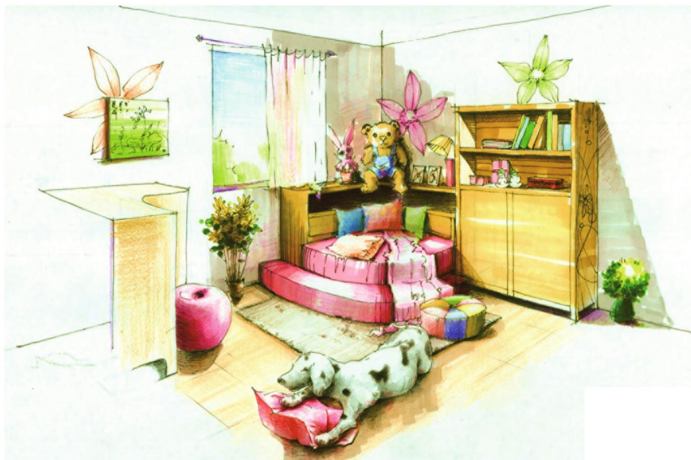
附件三、彩繪居家設計-玩樂風格兒童房彩圖範例